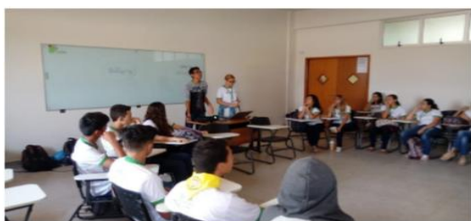
Imagem 1. Roda de conversa com os ingressantes do 2/2018

Fez-se a aplicação do questionário em duas turmas recém ingressantes do IFMS-CB. A pesquisa tratou de um formulário preenchido à mão, com 14 perguntas, incluindo questões dissertativas, assim, fez-se o levantamento dos dados. Iniciadas as rodas de conversa nessas turmas com base nas suas respostas do questionário, foi exposto aos alunos o significado de bullying, junto com jogos de palavras e dinâmicas que os levassem a experimentar dar e receber tanto opiniões ruins quanto boas de si mesmos, incentivando o respeito entre todos participantes. A partir desta perspectiva, espera-se oferecer também aos alunos e outros o acesso ao blog para depor sua experiência ou comentar as postagens de modo anônimo, permitindo a eles, assim, sua liberdade de expressão.